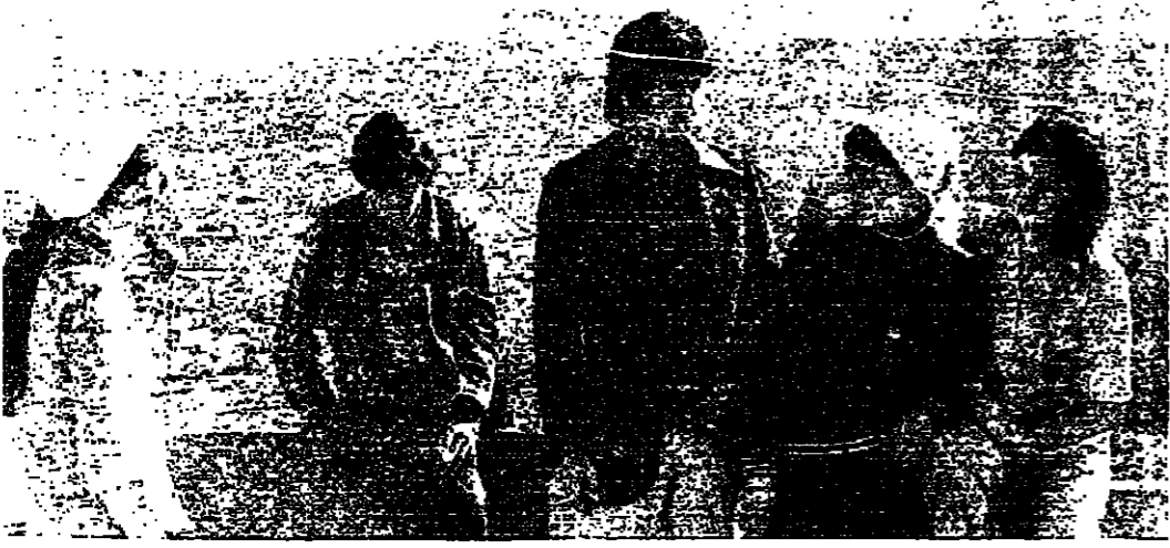
في قرية ايبية بواجهة بطاح فلسطين المحتلة